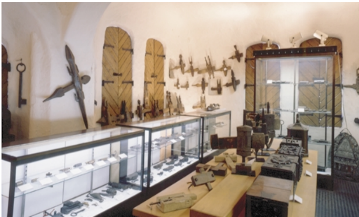
2階の一室にある資料室。世界各地の手作りのカギが並んでいる