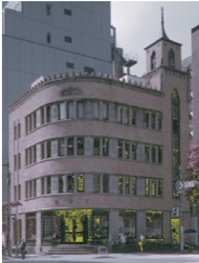
外堀通りに面した堀商店全景。全体に丸味をおびているのが特長だ