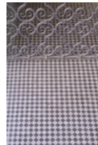
1階店舗の床は竣工当時の モザイクタイルが使われている