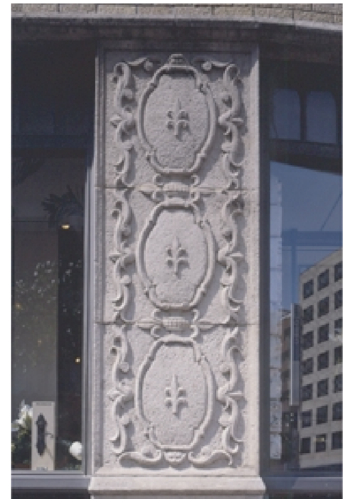
外壁のレリーフ。植物の芽をイメージしている

東京都は、景観づくりを総合的・計画的に進めることを目的として、平成9年12月に東京都景観条例を制定。その条例に基づいて、景観審議会が選定すべきとして答申した景観上重要な建造物のうち、所有者の同意を得たものを選定している。ただし、重要文化財、登録有形文化財、都及び区市町村が指定した文化財は除かれる。