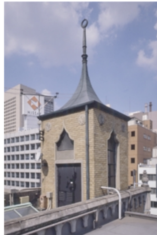
竣工時のまま使われている塔屋。 当時は高い建物がなかったため、火の見やぐら的に使用されていた